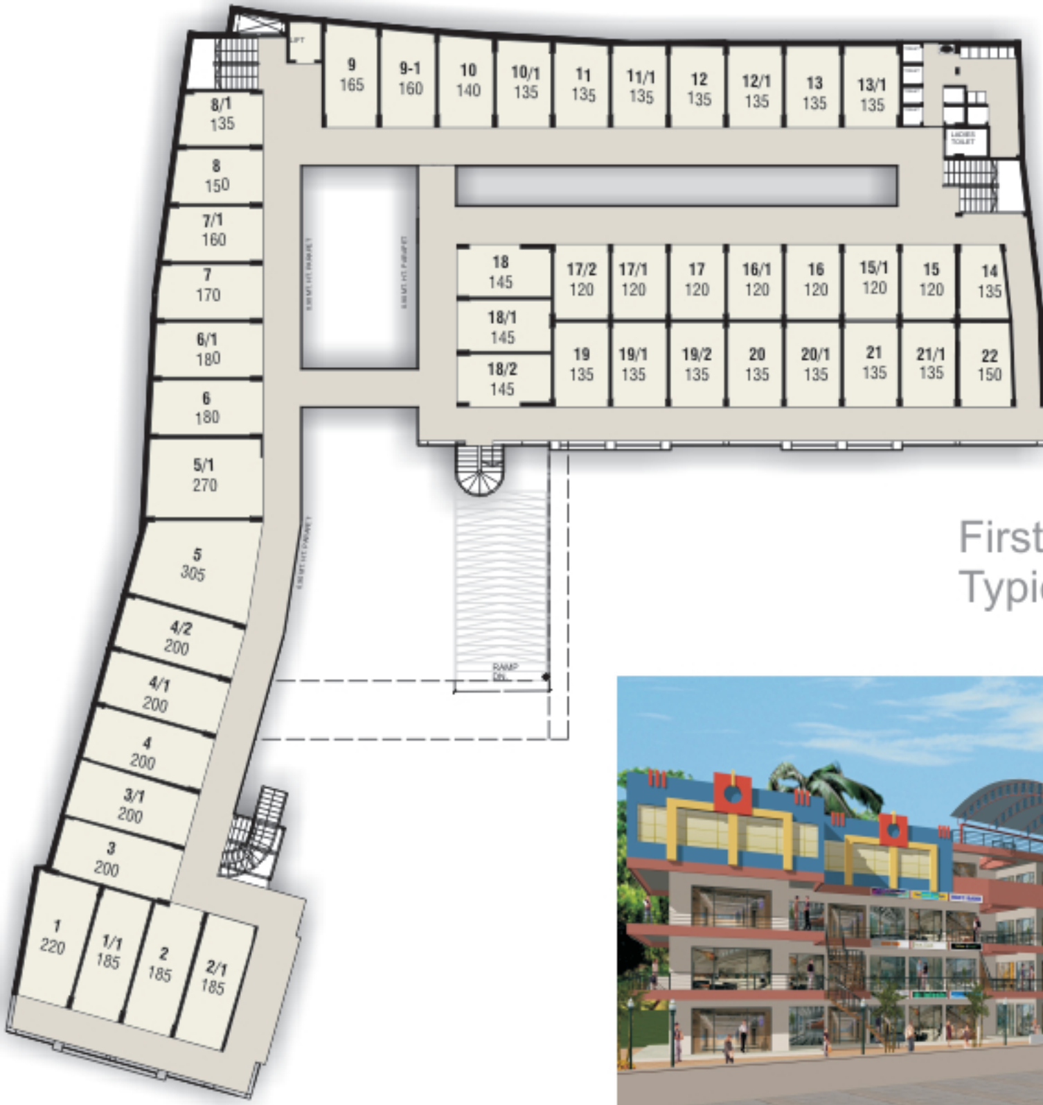
First, Second & Third Typical Floor Plan